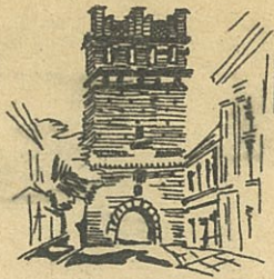
Sandomierz, Brama Opatowska z XIVw.